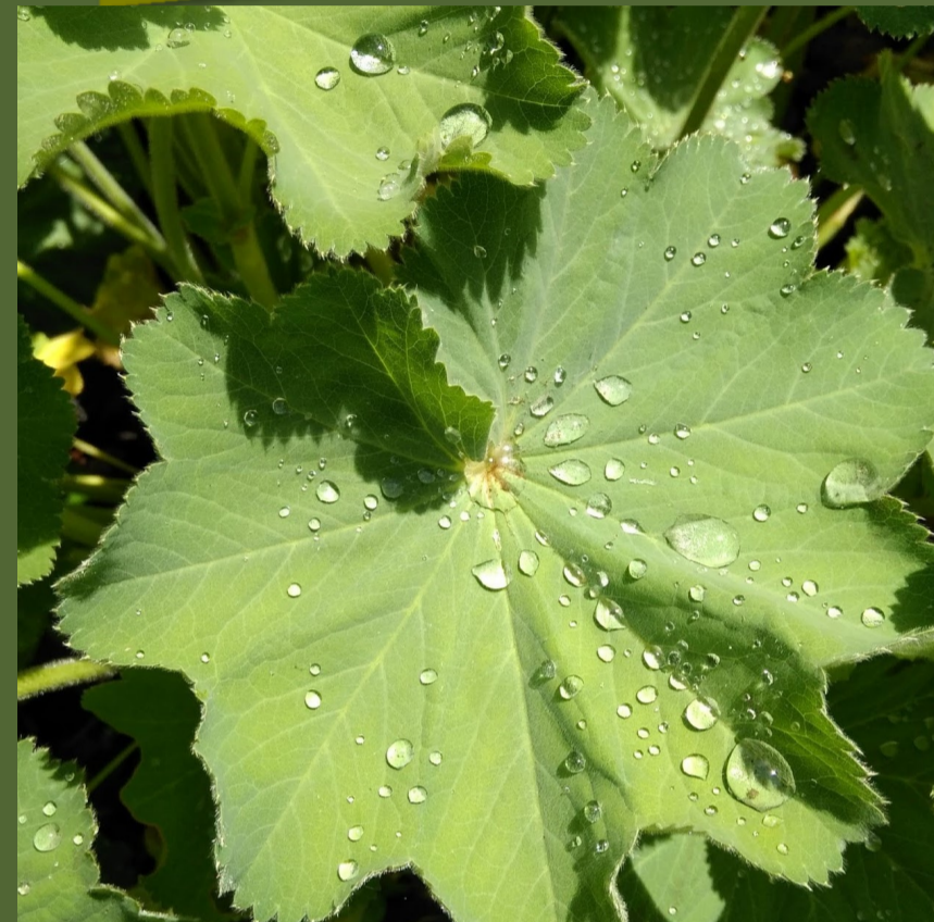
Lotuseffekt auf Frauenmantel