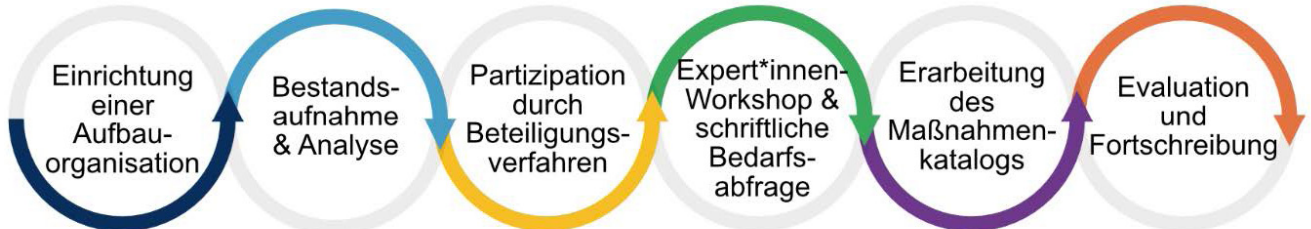
Abbildung 3: Entwicklungsprozess / Eigene Darstellung

Im Rahmen der Erarbeitung des zweiten Aktionsplans wurden vier zentrale Handlungsfelder definiert, die auf die Bekämpfung von geschlechtsspezifischer Gewalt und die Förderung von Gleichberechtigung abzielen. Diese Handlungsfelder dienen als Leitlinien und praxisorientierte Ansätze, die konkrete Maßnahmen und Strategien umfassen, um nachhaltige Fortschritte im Bereich des Schutzes und der Prävention von Gewalt zu erzielen. Sie orientieren sich an den bestehenden Rahmenbedingungen, die die EU-Charta einerseits durch ihre Grundsätze mit Bezug auf die Artikel der Istanbul Konvention vorgibt und andererseits an den analysierten Daten der Bestandsanalyse und wurden in enger Zusammenarbeit mit relevanten Akteur*innen in dem bereits vorgestellten partizipativen Prozess entwickelt.