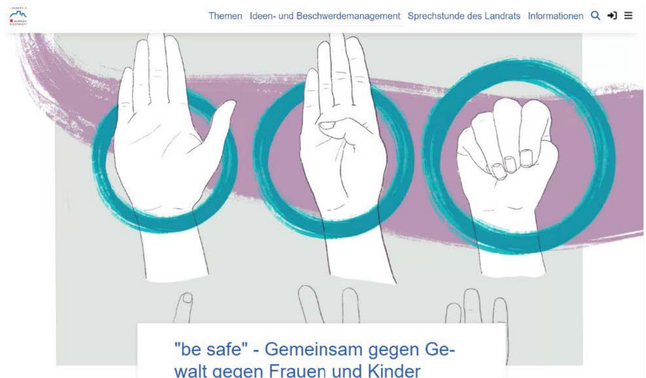
Abbild 1: Beteiligungsformat Online-Dialog mit Ideenwerkstatt

Dieses Format ermöglichte eine niedrighschwellige und breite Beteiligung der Bevölkerung. Über die digitale Plattform „Mein-Marburg-Biedenkopf“ konnten Bürger*innen ihre Erfahrungen und Vorschläge zur Beseitigung von geschlechtsspezifischer Gewalt einbringen und Ideen äußern, was es im Landkreis Marburg-Biedenkopf noch benötigt, um den ganzheitlichen Ansatz des Gewaltschutzes zu ermöglichen. Die Online-Ideenwerkstatt fördert den offenen Austausch und schafft einen barrierearmen Zugang für alle Interessierten, unabhängig von ihrem geografischen Standort.