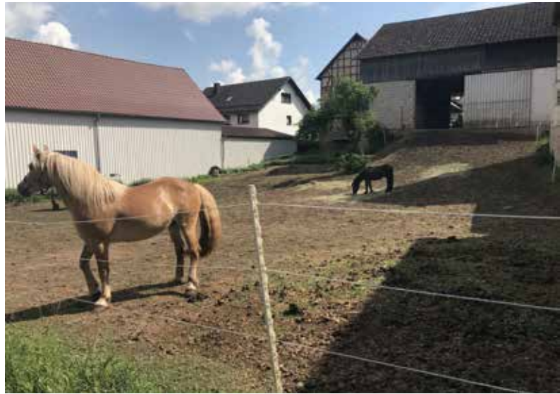
● Pferdeweide Frohnhausen

Um einer dauerhaften Beeinträchtigung von Ortsbild, Wohnumfeldqualität und Immobilienmarkt entgegenzuwirken, sind nachhaltige Strategien zum Umgang mit Leerstand von Wohngebäuden, Nebengebäuden, Gewerbeimmobilien usw. gefragt. Für die entsprechenden Anpassungserfordernisse müssen Handlungsoptionen für die Ortskerne formuliert werden. Es sind konkrete Aussagen zu den vorhandenen Siedlungsbereichen einschließlich Grünordnung, Gebäuden und Infrastrukturen zu erarbeiten.