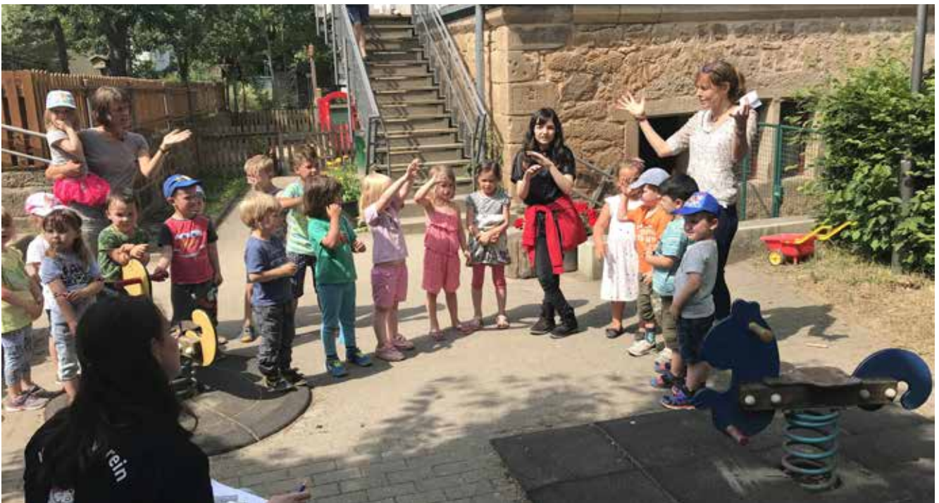
● Kindergarten Ermschwed

Die Handlungsstrategie baut auf den Ergebnissen der Stärken- und Schwächen-Analyse und den Zielen auf und benennt die daraus abgeleiteten zentralen Handlungsfelder und Vorhaben. Die Handlungsstrategie ist das zentrale Element eines integrierten kommunalen Entwicklungskonzeptes.