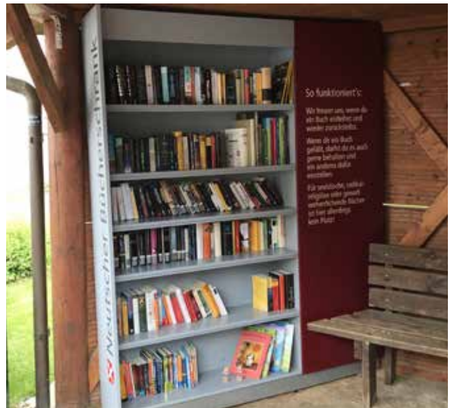
● Bücherschrank Neutsch

Dezentrale Angebote zur Förderung des lebenslangen Lernens können die Attraktivität als Wohn- und Lebensstandort erhöhen. Sie können ggf. durch bestehende Institutionen oder bürgerschaftliches Engagement ausgebaut werden.