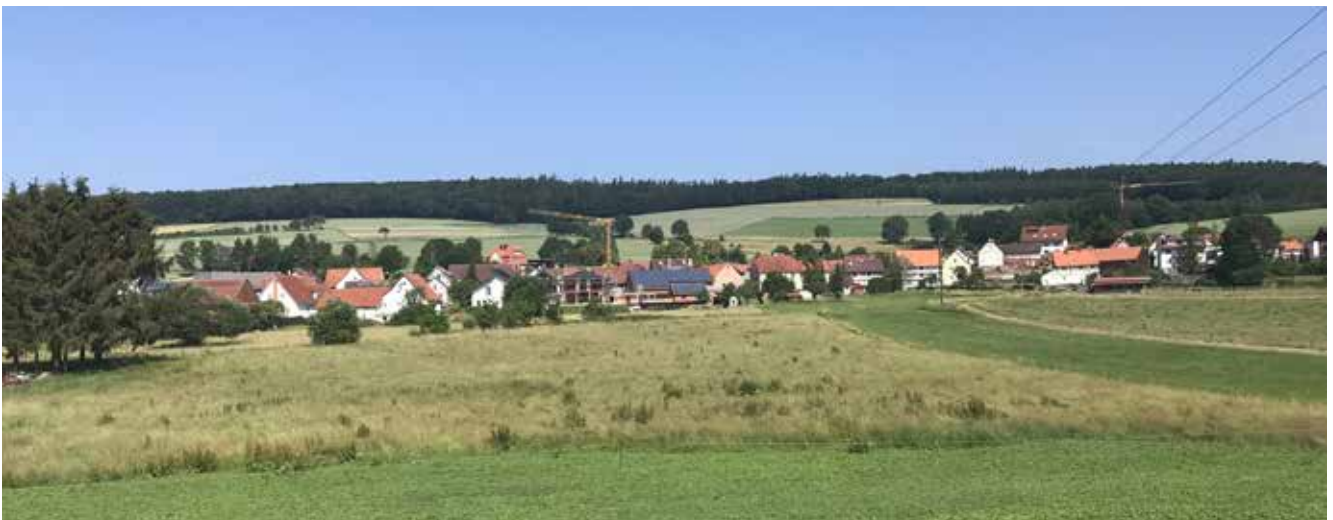
● Neubaugebiet Kathus

Erklärte Zielsetzung der Dorfentwicklung ist die Lenkung der Investitionen in die Ortskerne. Daher sind grundsätzlich nur Investitionen in den Ortskernen förderfähig. Die Richtlinie sieht für private Vorhaben eine Förderung nur in den abgegrenzten Fördergebieten in den Ortskernen und bei Kulturdenkmälern vor. Im IKEK ist die Fördergebietsabgrenzung für private Antragsteller zu erarbeiten. Sie ist aus der Siedlungsgenese abzuleiten und der Gebietszuschnitt sollte unter strategischen Gesichtspunkten (Lage, Struktur, Funktion und Bedeutung, Lenkung der Fördermittel) festgelegt werden.