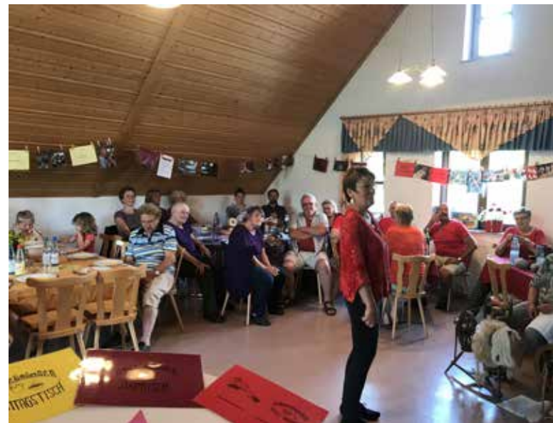
● Dorfgemeinschaft Poppenhausen

Die Bürgerinnen und Bürger sind auch im Rahmen des IKEK-Prozesses ehrenamtlich zu beteiligen. Es sollte darauf hingewirkt werden, dass diese Mitwirkung an strategischen Fragen nach der Erarbeitung des IKEK fortbesteht. Hierzu sind geeignete Strukturen anzustoßen. Schließlich sollte die Kommune zur Unterstützung eines flexiblen ehrenamtlichen Engagements bei der Kommunikation von Möglichkeiten ehrenamtlichen Engagements tätig werden.