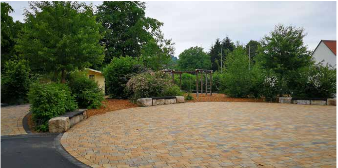
● Schulhof Ober-Schmitten