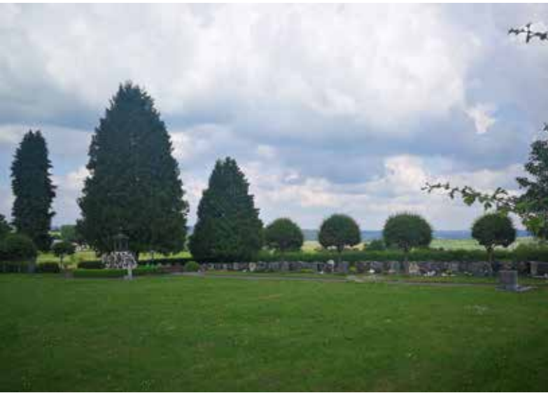
● Friedhof Fronhausen

finanzierbaren Maßnahmen im Rahmen der Dorfentwicklung begleitet werden, um das Schrumpfen zu organisieren und die Situation in den ländlichen Räumen insgesamt zu stabilisieren.