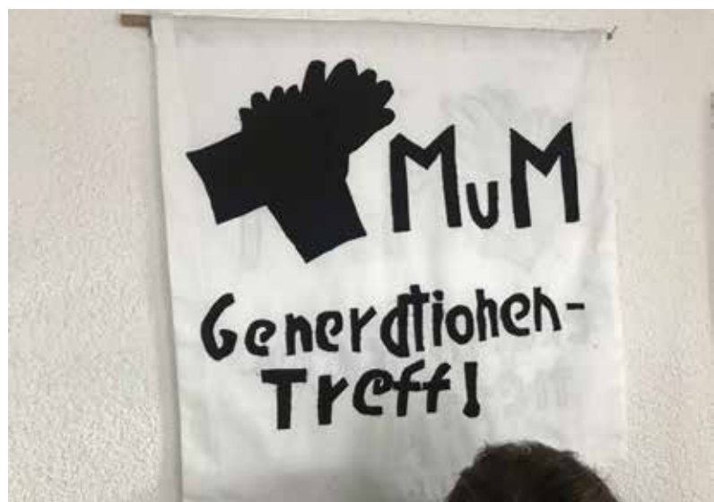
● Generationentreff Raboldshausen

Der demographische Wandel zeigt insbesondere Auswirkungen in den verschiedenen Bereichen der öffentlichen Daseinsvorsorge. Vor dem Hintergrund einer Sicherstellung gleichwertiger Lebensverhältnisse in den ländlichen Räumen sind die Entwicklungen der sozialen Infrastruktur und Daseinsvorsorge eine wesentliche Aufgabe von Politik und öffent-