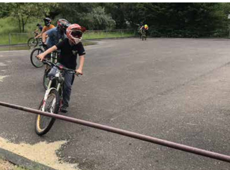
● Funpark Niederwalgern

Zur Erreichung dieses Programmziels ist eine Auseinandersetzung mit der städtebaulichen Entwicklung ein festes Modul und zentrales Handlungsfeld im IKEK. Grundlage der städtebaulichen Entwicklung ist die Erfassung des bau- und kulturgeschichtlichen Erbes sowie der Innenentwicklungspotentiale (Leerstände, Baulücken usw.) der Ortskerne. Darüber hinaus ist eine Überprüfung der aktuellen Planungen sowie der Zielrichtung der Siedlungsentwicklung erforderlich.