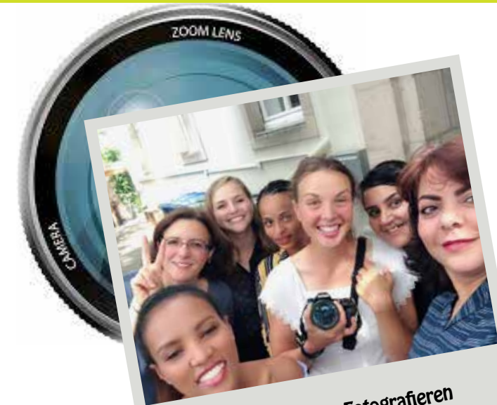
Ausflüge, Kultur, Fotografieren