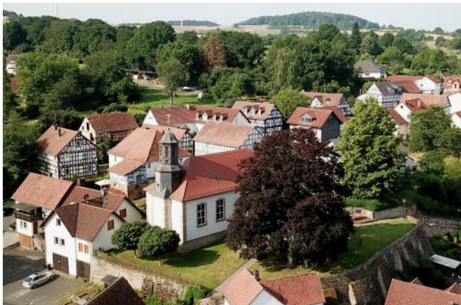
Die Kirche in Goßfelden

Goßfelden , in der Kirche, Roßweg 14, 35094 Lahntal-Goßfelden Beginn: 18 Uhr Eintritt 8,- € / ermäßigt 5,- € Veranstalter: Zwei Raben — Literatur in Ober- hessen e.V.