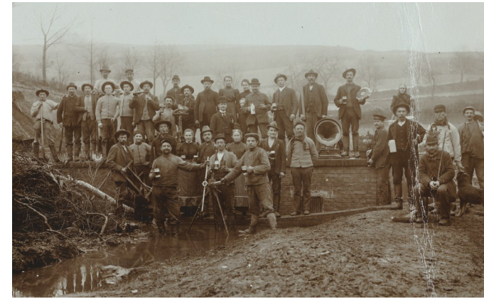
Bau des Gruppenwasserwerks Gemünden-Bunstruth, Landkreis Waldeck-Frankenberg, 1910.