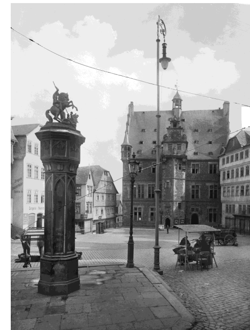
Markplatz in Marburg mit Strom- und Gaslampen, um 1900.

Z.B.: Marburg (1906), Hartenrod (1911/12), Gladenbach (1912), Weidenhausen (1913), Fronhausen (1914), Niedereisenhausen (1914), Niederwalgern (1914), Niederweimar (1915), Wenkbach (1919), Wittelsberg (1919), Weipoltshausen (1920), Rauschenberg (1920), Stedebach (1921), Seelbach (1921), Lohra (1922), Altenvers (1922), Damm (1922), Rodenhausen (1922), Kirchvers (1923), Reimershausen (1923), Allna (1927), Weiershausen (1927), Nanz-Willershausen (1927/28), Rollshausen (1928)