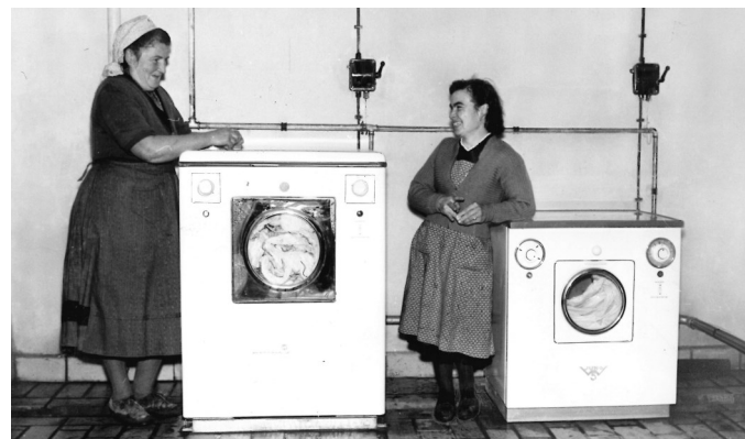
Gemeinschaftswaschanlage in Kleinseelheim, Landkreis Marburg-Biedenkopf, um 1950. Zur Verfügung gestellt von Wilhelm Lotz, Marburg

Elektrizität und fließendes Wasser durchdringen heute alle Lebensbereiche. Strom aus der Steckdose und Wasser aus der Leitung sind bereits zur selbstverständlichen Notwendigkeit geworden. Doch welchen Einfluss hatten Elektrifizierung und Wasserversorgung im frühen 20. Jahrhundert auf Kultur und Lebensweise in unserer Region? Arbeiten, Freizeit und Wohnen haben sich durch die Strom- und Wasserversorgung grundlegend verändert. Die Nutzung von Strom und fließendem Wasser bedeutete also nicht nur Arbeitserleichterung und Fortschritt, sondern vor allem den damit verbundenen sozio-kulturellen Wandel der Gesellschaft. Eine Ausstellung zu diesem Themenkomplex ist im Foyer der Kreisverwaltung ab dem 27. September 2018 bis zum 1. November 2018 während der Öffnungszeiten der Kreisverwaltung (montags bis donnerstags: 7:30 Uhr bis 16 Uhr und freitags 7:30 Uhr bis 14 Uhr) zu sehen. Interessierte sind herzlich dazu eingeladen.