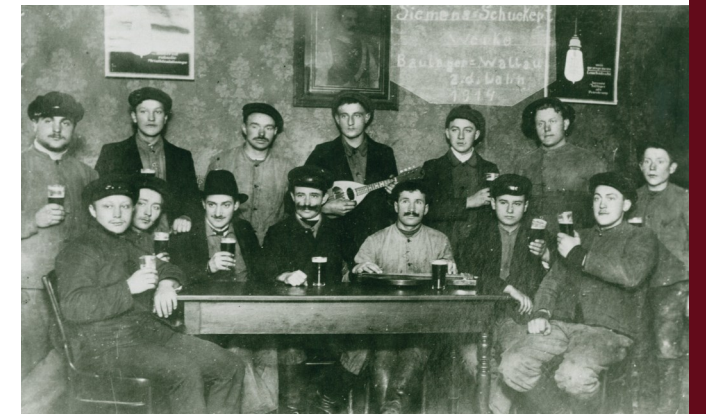
Baukolonne der Siemens-Schuckert-Werke GmbH nach Feierabend in Wallau, Landkreis Marburg-Biedenkopf, 1914.

Wurde der Strom zunächst nur für Arbeitsgeräte im Handwerk und in der Landwirtschaft genutzt oder zur Beleuchtung der Werkstätten und Ställe, ersetzte das elektrische Licht bald schon die rußenden und geruchsbildenden Petroleumlampen in den Wohnhäusern.